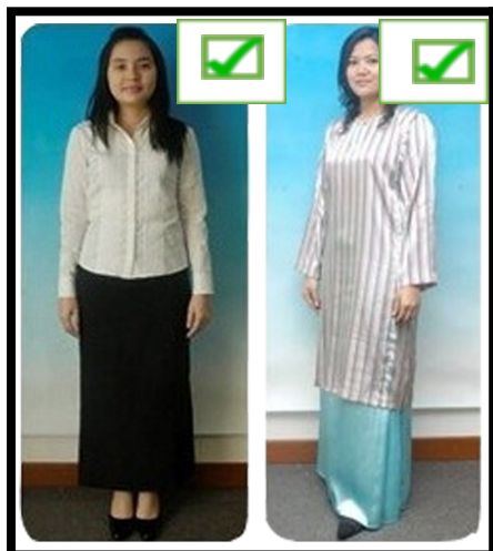
PAKAIAN GRADUAN PEREMPUAN BUKAN ISLAM