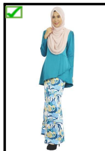
TUDUNG BERWARNA PUTIH / KRIM SAHAJA YANG DIBENARKAN