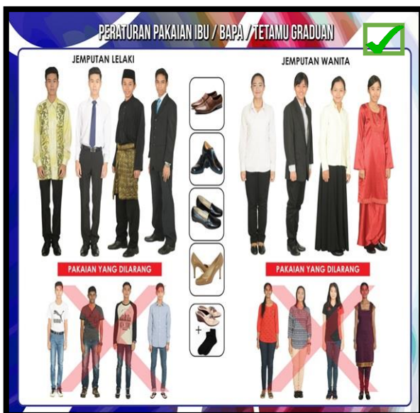
PAKAIAN FORMAL (BATIK/KEMEJA/BAJU KURUNG/KEBAYA)