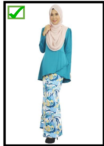
TUDUNG BERWARNA PUTIH / KRIM SAHAJ YANG DIBENARKAN