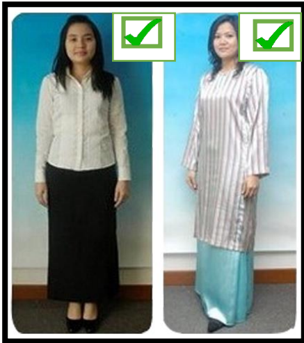
PAKAIAN GRADUAN PEREMPUAN BUKAN ISLAM